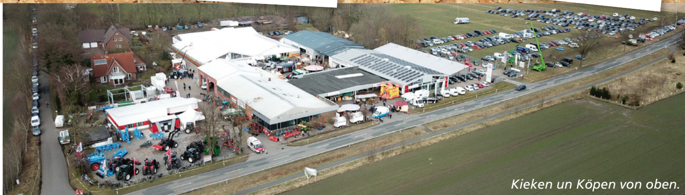
Kieken un Köpen von oben.

Arbeit über die Schulter schauen und sicherlich das ein oder andere Mitbringsel erwerben kann.